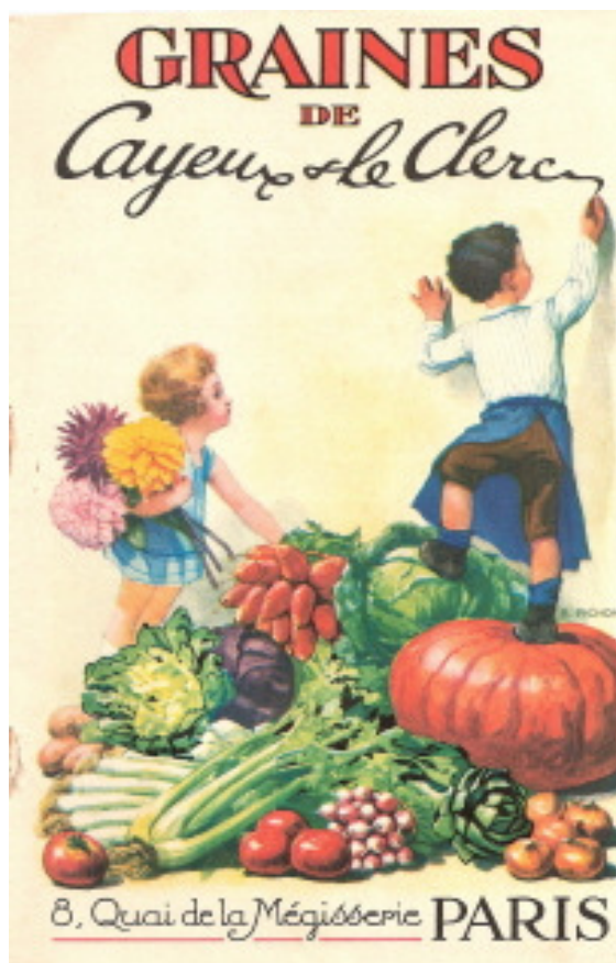
Voorpagina van zaadfirma 'Cayeux & le Clerc' uit 1929.