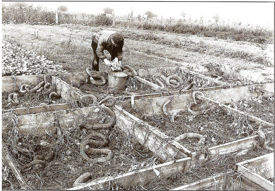
Zaadoogst van slangkomkommer ergens in Frankrijk. Uit 'Espèces de Courges : Culture et usages des Cucurbitacées' meerdere auteurs--Edition Equinoxe-2000-Cavaillon-F-