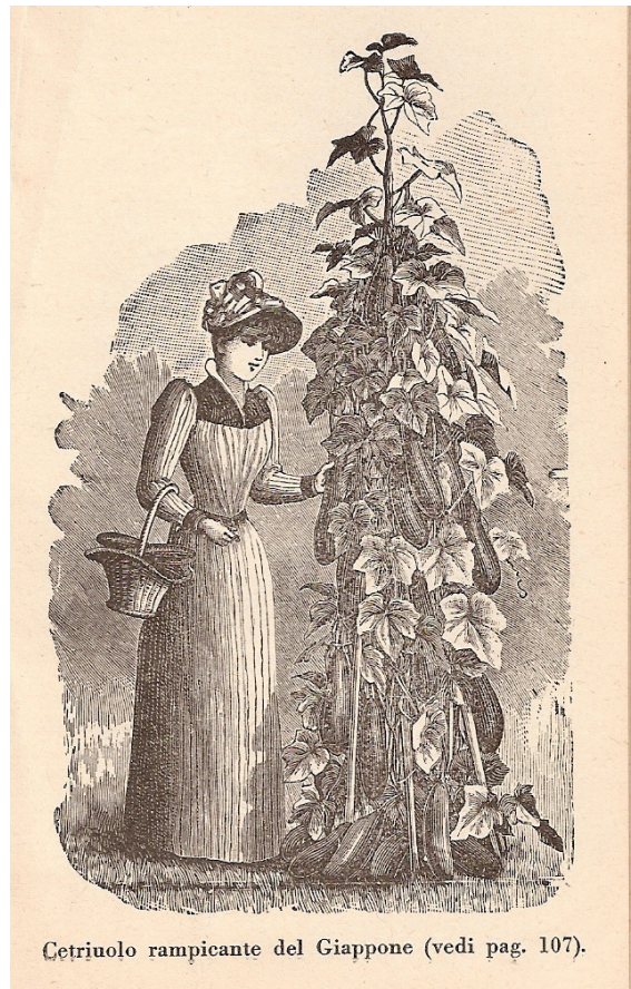
Cetriuolo rampicante del Giappone (vedi pag. 107).

Cliché uit zadencatalogus Mezőgazdák-Budapest-anno-1933-