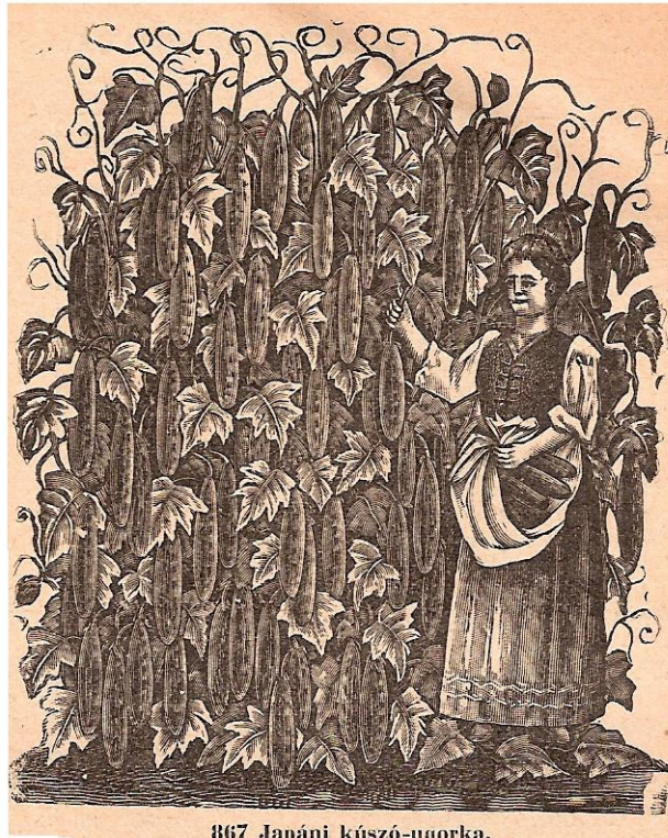
867 Japáni kúszó-uorka.

Cliché uit zadencatalogus Mezőgazdák-Budapest-anno-1933-