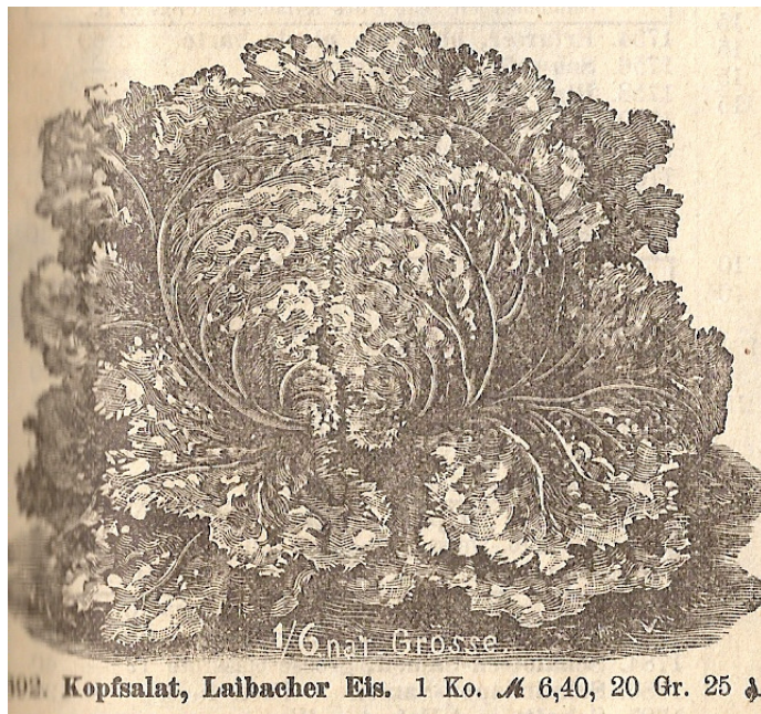
103. Kopfsalat, Laibacher Eis. 1 Ko. M 6,40, 20 Gr. 25 ¢

*'Cavolo di Napoli' Cliché uit J.Decaisne & C.Naudin (1865)