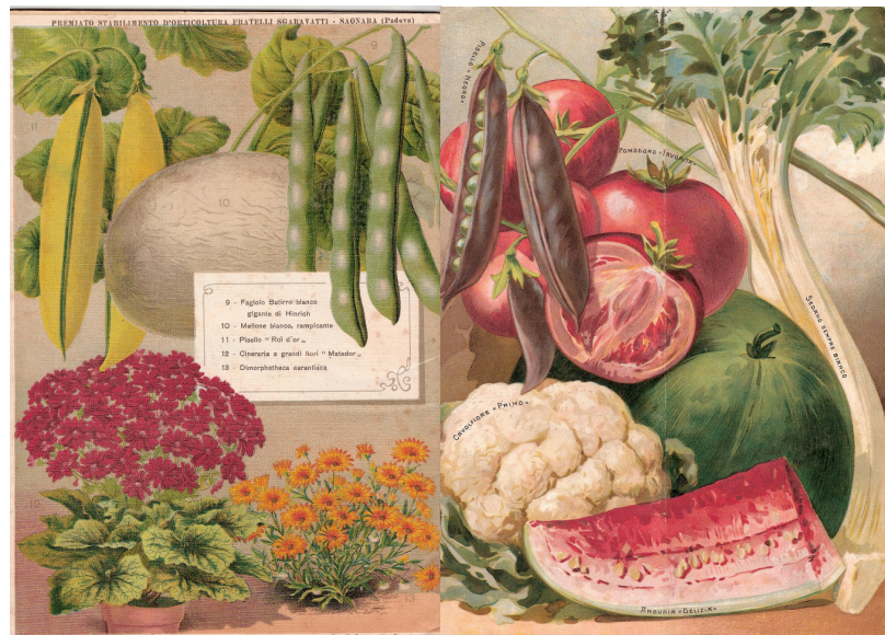
Kleurplaten uit F.Sgaravatti (l.) F.Ingegnoli (r.) met bovenaan links resp 'Roi d'Or' en 'Negro'